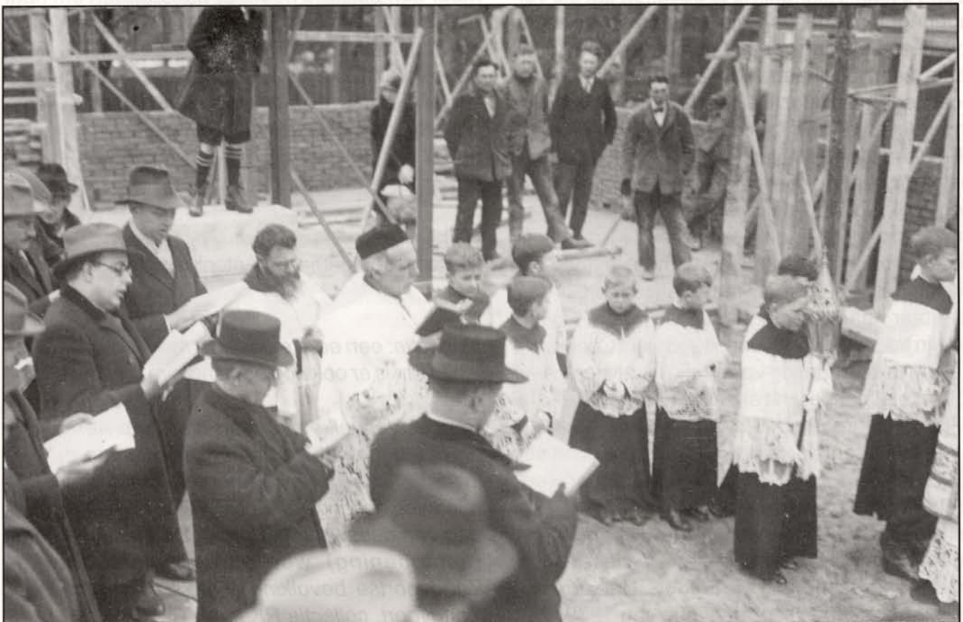
Eerste steenlegging van de nieuwe Agatha kerk: 13 maart 1928